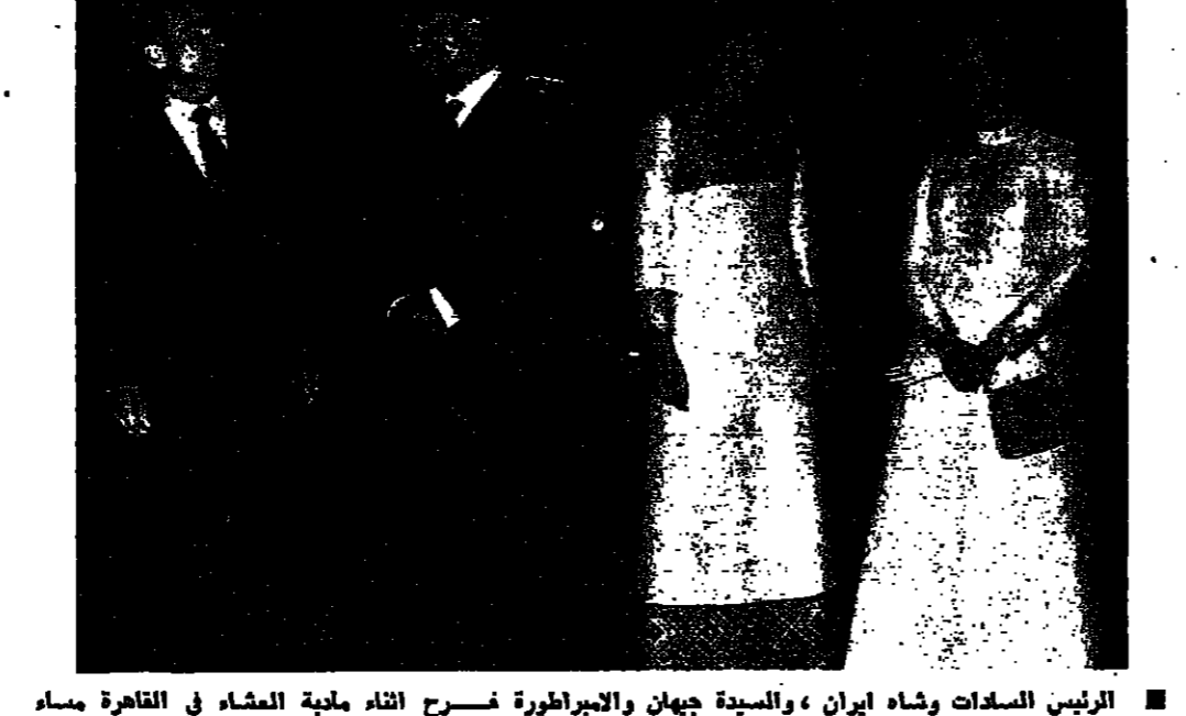
الرئيس السادات وشاه ايران، والسيدة جيهان والاميرة فخر أثناء مائدة العشاء في القاهرة مساء أمس الأول